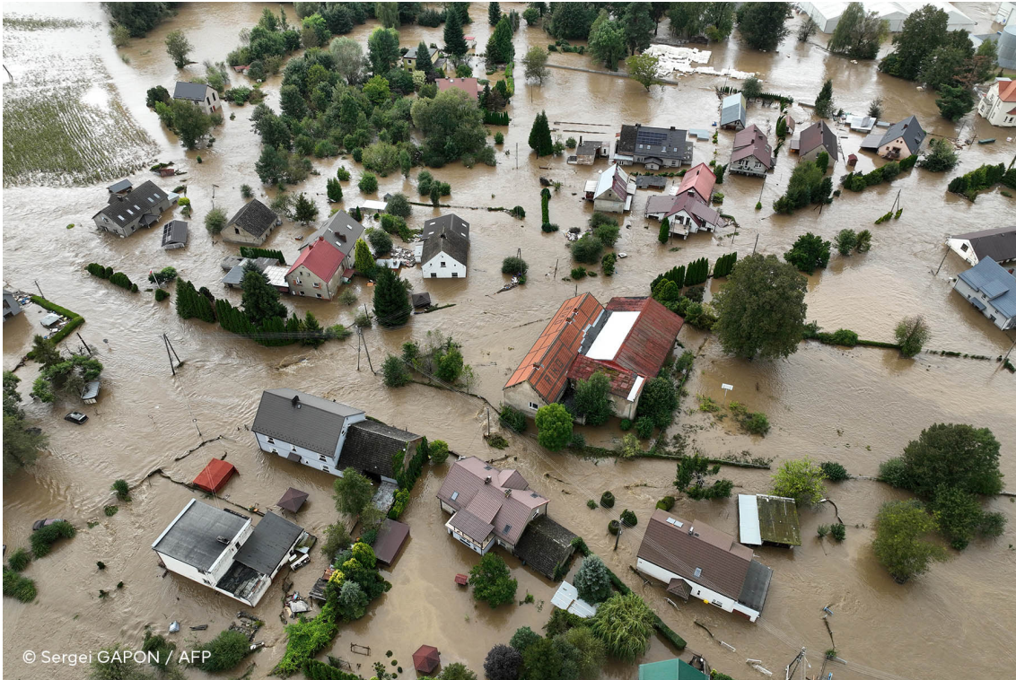
Καταστροφικές πλημμύρες έπληξαν την Κεντρική και Ανατολική Ευρώπη τον Σεπτέμβριο του 2024