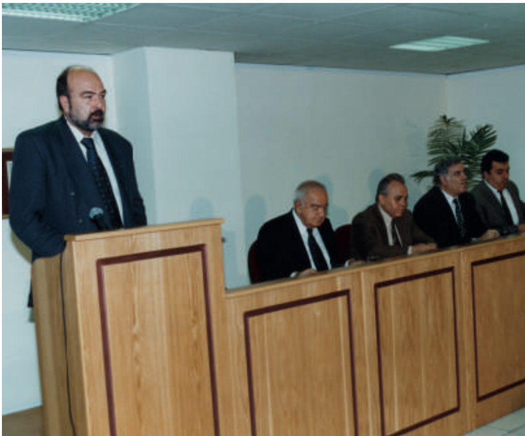
Ο κ. Α. Πολίτης, Αντιπρόεδρος της Ο.Κ.Ε.

στημα τιμαριθμικής αναπροσαρμογής των κλιμακίων της φορολογίας εισοδήματος, κάτι που ανταποκρίνεται στη φορολογική δικαιοσύνη και συμβάλει στη σταθερότητα της φορολογικής μας νομοθεσίας.