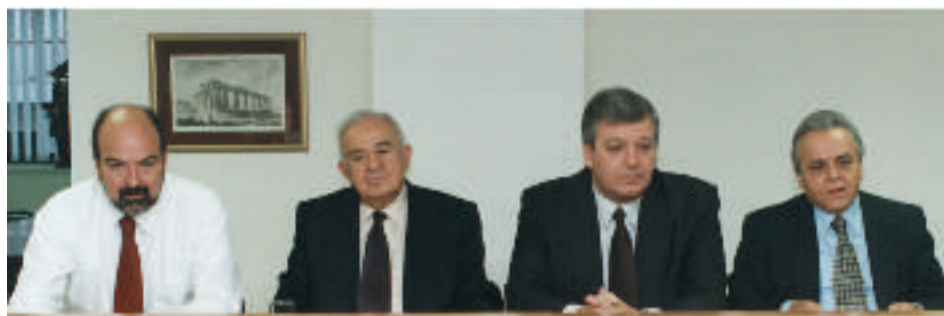
Πάνω: Το Προεδρείο της Ο.Κ.Ε. και ο Υφυπουργός Εργασίας κ. Χ. Πρωτόπαπας

Η προτεινόμενη αναμόρφωση του ρυθμιστικού πλαισίου των εργασιακών σχέσεων εκτιμάται ότι δε θα συμβάλει στην αύξηση της απασχόλησης. Οι προτεινόμενες ρυθμίσεις για την κατάργηση της υπερεργασίας, τη γενική αύξηση της αμοιβής των υπερωριών και τη μείωση του εβδομαδιαίου χρόνου εργασίας από 40