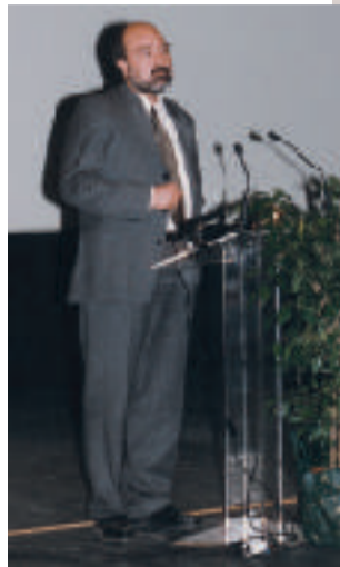
Πάνω: Ο Αντιπρόεδρος της Ο.Κ.Ε. Δεξιά: Το πάνελ της Δημόσιας Συζήτησης