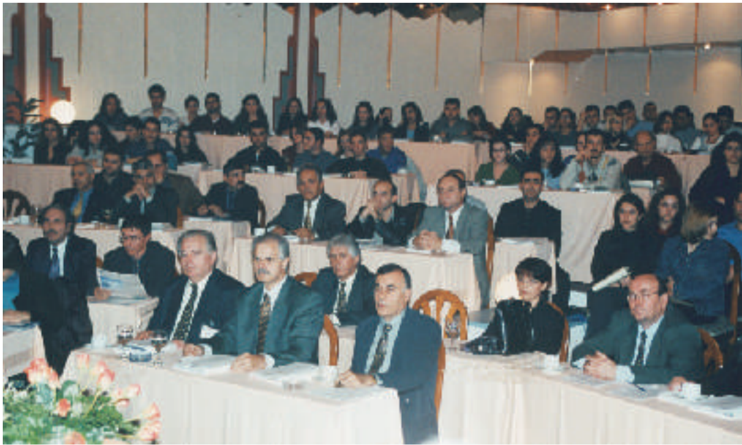
Συνέχεια από τη σελ. 12

προβλήματος δεν αποτελεί μέριμνα μόνο των πολιτικών φορέων ούτε μπορεί να αφεθεί στην κοινωνική πίεση μόνο των ίδιων των ενδιαφερομένων. Οι κοινωνικοί φορείς, παρακινούμενοι από το αίσθημα της κοινωνικής αλληλεγγύης, αλλά και συναισθανόμενοι τις ευρύτερες συνέπειες της φτώχειας για το σύνολο του πληθυσμού και τη συνοχή της κοινωνίας, οφείλουν να εντάξουν τη φτώχεια στην πολιτική και κοινωνική ημερήσια διάταξη της χώρας μας.