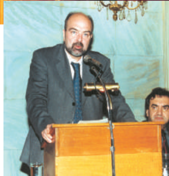
Πάνω: ο Πρόεδρος της Βουλής κ. Α. Κακλαμάνης και ο Πρόεδρος της Ο.Κ.Ε. κ. Α. Κιντής Κάτω: οι Αντιπρόεδροι της Ο.Κ.Ε. κ.κ. Δ. Κυριαζής (Α' Ομάδα) και Δ. Πολίτης (Β' Ομάδα)