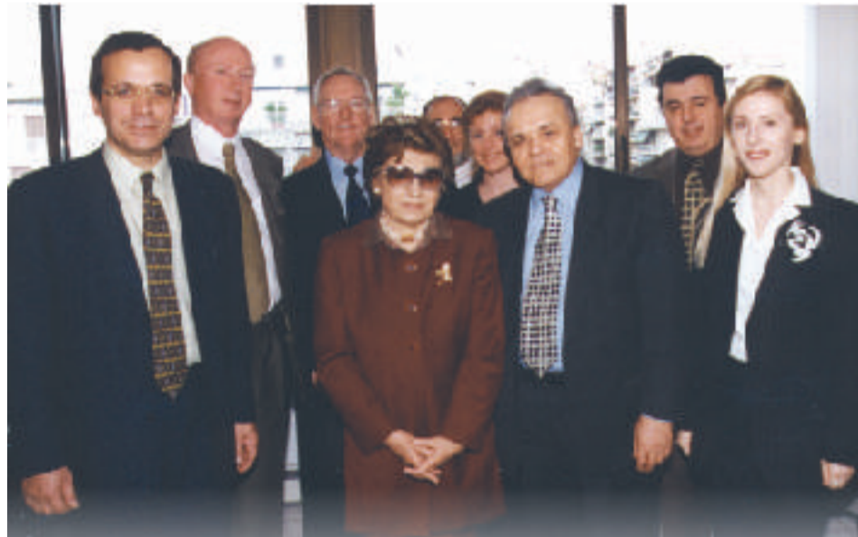
Συνάντηση της Επιτροπής Παρακολούθησης