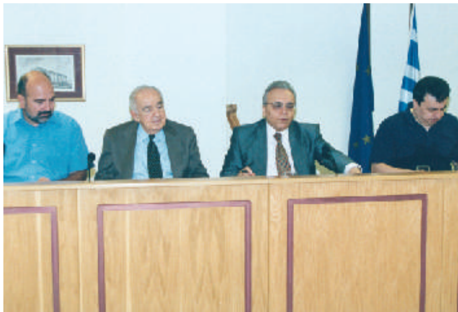
Το Προεδρείο και ο Γενικός Γραμματέας της Ο.Κ.Ε.

Το Επιχειρησιακό Πρόγραμμα «Πολιτισμός 2000-2006» αποτέλεσε για την Ο.Κ.Ε. μία πρώτη ευκαιρία να εκφέρει άποψη για έναν τομέα -τον Πολιτισμό- που έχει αυξημένη βαρύτητα για την ανάπτυξη και τη διεθνή και ευρωπαϊκή προβολή της χώρας στο μέλλον. Με βάση αυτήν την εκτίμηση η Ο.Κ.Ε., εκφράζοντας το σύνολο των κοινωνικών φορέων, αποφασίζει να προβεί σε ολοκληρωμένες προτάσεις για το σύνολο της πολιτιστικής πολιτικής σε μία Γνώμη Πρωτοβουλίας που προτίθεται να εκδώσει στο άμεσο μέλλον.