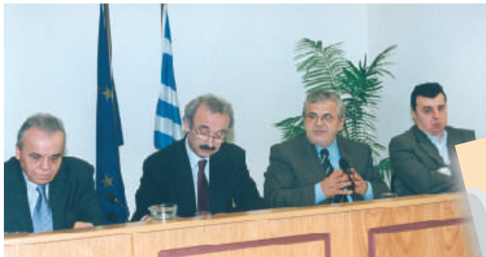
Ο Πρόεδρος της Ο.Κ.Ε., ο κ. Χ. Πάχτας, Υφυπουργός Οικονομίας και Οικονομικών, ο κ. Ρ. Σπυρόπουλος, Υφυπουργός Εργασίας και Κοινωνικών Ασφαλίσεων και ο Γενικός Γραμματέας της Ο.Κ.Ε.