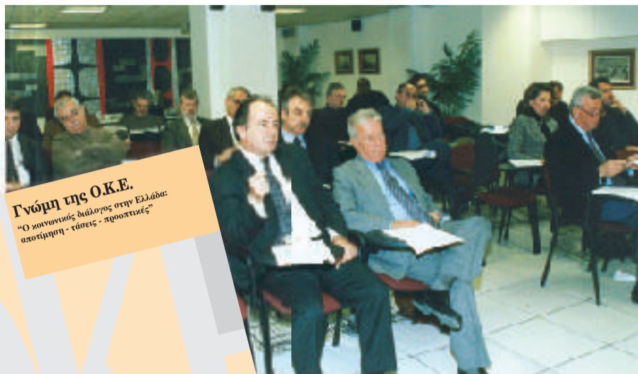
Η Ολομέλεια της Ο.Κ.Ε.

Σ υνήλθε την Τετάρτη, 18 Δεκεμβρίου 2002, η Ολομέλεια της Οικονομικής και Κοινωνικής Επιτροπής (Ο.Κ.Ε.), προκειμένου να εκφράσει Γνώμη Πρωτοβουλίας με θέμα «Ο Κοινωνικός Διάλογος στην Ελλάδα: Αποτίμηση - Τάσεις - Προοπτικές».