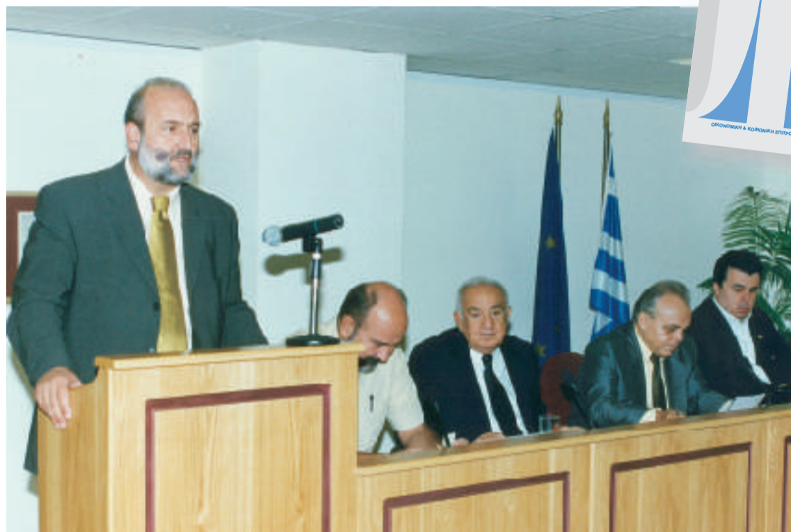
Το Προεδρείο και ο Γενικός Γραμματέας της Ο.Κ.Ε.

είχε προτείνει στο παρελθόν ότι η χώρα μας έπρεπε να προσπαθήσει να δεσμεύσει, τουλάχιστον, το 20% του Γ' Κ.Π.Σ. για τον αγροτικό τομέα για να υπάρχουν ρεαλιστικές προοπτικές υλοποίησης της ολοκληρωμένης αγροτικής ανάπτυξης. Ως εκ τούτου, εκφράζεται προβληματισμός σχετικά με την επάρκεια των πιστώσεων του Επιχειρησιακού Προγράμματος «Αγροτική Ανάπτυξη/Ανασυγκρότηση της Υπαίθρου 2000 - 2006».