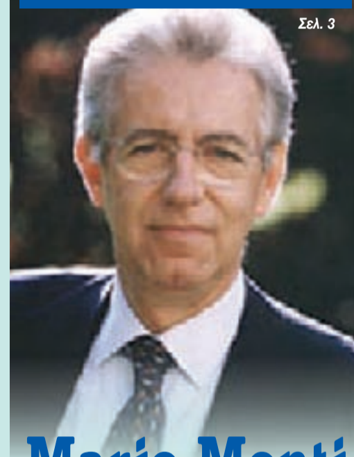
Mario Monti Επίτροπος της Ε.Ε.