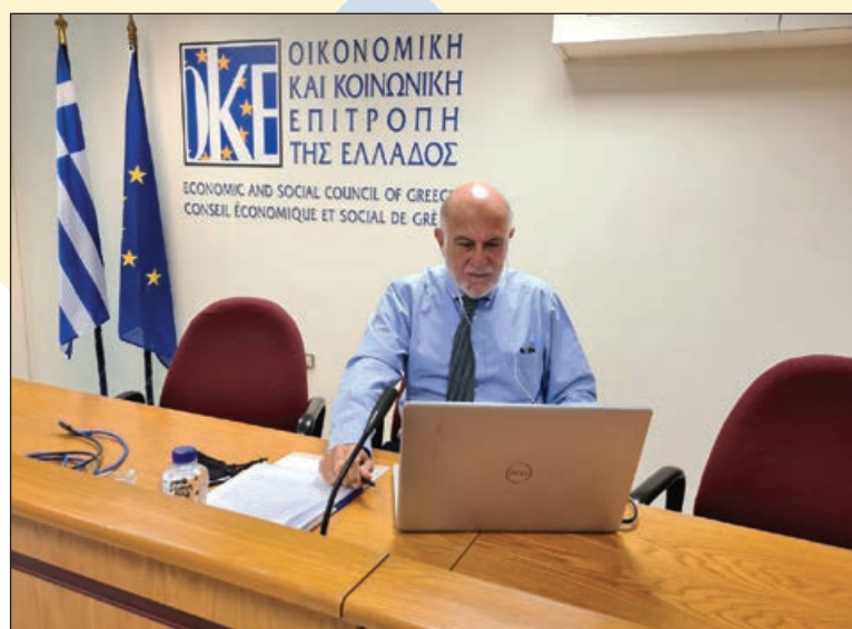
Παρέμβαση του Προέδρου της Ο.Κ.Ε., Γιώργου Βερνίκου στη συνεδρίαση της Διαρκούς Επιτροπής Παραγωγής και Εμπορίου της Βουλής των Ελλήνων για το Σχέδιο Νόμου «Εκσυγχρονισμός της Χωροταξικής και Πολεοδομικής Νομοθεσίας»