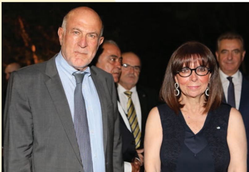
Συνάντηση του Προέδρου της Ο.Κ.Ε., Γιώργου Βερνίκου, με την Πρόεδρο της Ελληνικής Δημοκρατίας, Κατερίνα Ν. Σακελλαροπούλου