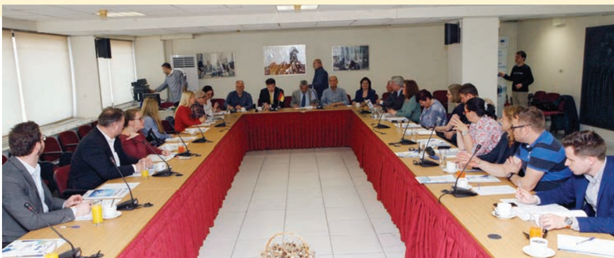
Επίσκεψη αντιπροσωπείας της Κοινοβουλευτικής Επιτροπής για την Υγεία, τη Φροντίδα και την Ισότητα των Φύλων του Κρατιδίου του Βερολίνου Αθήνα, 18/4/2018