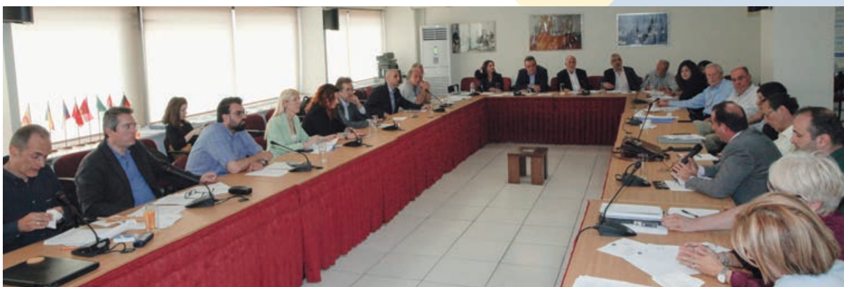
Συνάντηση με το Σωκράτη Φάμελλο, Αν. Υπουργό Περιβάλλοντος και Ενέργειας Αθήνα, 23/5/2018