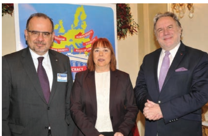
Από αριστερά: Luca Jahier, Πρόεδρος Ε.Ο.Κ.Ε., Isabel Caño Aguilar, Αντιπρόεδρος Ε.Ο.Κ.Ε., και Γιώργος Κατρούγκαλος, Αν. Υπουργός Εξωτερικών της Ελλάδας

Την Πέμπτη, 22 Νοεμβρίου 2018 , και την Παρασκευή, 23 Νοεμβρίου 2019 , ενόψει των Ευρωπαϊκών εκλογών, η Ευρωπαϊκή Οικονομική και Κοινωνική Επιτροπή (ΕΟΚΕ) διοργάνωσε στην Αθήνα σεμινάριο με θέμα «Επαναβεβαίωση των αξιών της Ευρώπης», παρουσία του Προέδρου της, κ. Luca Jahier, και της Αντιπροέδρου της, κυρίας Isabel Caño Aguilar. Ο Έλληνας Αν. Υπουργός Εξωτερικών, κ. Γιώργος Κατρούγκαλος, καλωσόρισε τους συμμετέχοντες στην εκδήλωση, στην οποία είχαν προσκληθεί δημοσιογράφοι, πανεπιστημιακοί και εμπειρογνώμονες από κράτη μέλη της Ευρωπαϊκής Ένωσης.