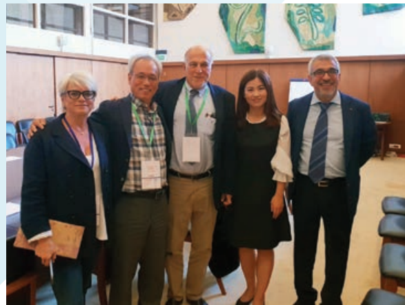
Με την αντιπροσωπεία του κορεάτικου ESC

Συμμετοχή αντιπροσωπείας της Ο.Κ.Ε. στη συνεδρίαση της Ολομέλειας της AICESIS