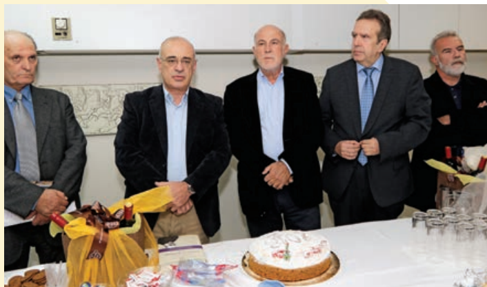
Κοπή πίτας Αθήνα, 17/1/2018