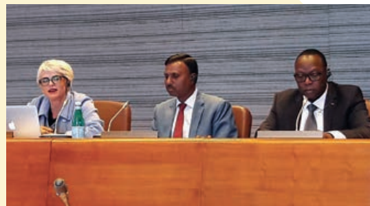
Συμμετοχή στο σεμινάριο της AICESIS για την Ψηφιακή Επανάσταση Γενεύη, 23-24/10/2018