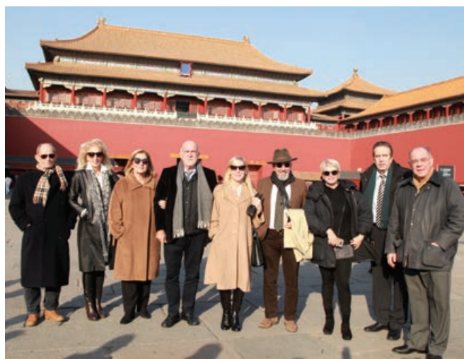
Πεκίνο: Ξενάγηση στην Απαγορευμένη Πόλη

ΕΕ, με στόχο την προαγωγή της συνεργασίας ΕΕ-Κίνας.