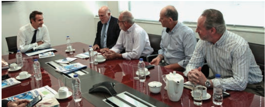
Ο κ. Κυριάκος Μητσοτάκης, Πρόεδρος της ΝΔ, με τον κ. Γιώργο Βερνίκο, Πρόεδρο της Ο.Κ.Ε., τον κ. Γιώργο Γωνιωτάκη, Αντιπρόεδρο, τον κ. Φώτη Κολεβέντη, Αντιπρόεδρο, και τον κ. Ιωάννη Πάιδα, Μέλος της Εκτελεστικής Επιτροπής

Τ ην Τετάρτη, 6 Σεπτεμβρίου 2017, το Προεδρείο της Ο.Κ.Ε. συναντήθηκε με τον Πρόεδρο της Νέας Δημοκρατίας, κ. Κυριάκο Μητσοτάκη. Ο Πρόεδρος της Ο.Κ.Ε., κ. Γιώργος Βερνίκος, ενημέρωσε τον κ. Μητσοτάκη για το έργο της Ο.Κ.Ε. και το σημαντικό ρόλο της, καθώς, όπως προβλέπει το Σύσταγμα της Ελλάδος, η Επιτροπή έχει ως αποστολή της τη διεξαγωγή του κοινωνικού διαλόγου για τη γενική πολιτική της χώρας και ιδίως για τις κατευθύνσεις της οικονομικής και κοινωνικής πολιτικής. Στην τοποθέτησή του ο κ. Μητσοτάκης ανέφερε, μεταξύ άλλων, τα εξής: «Θεωρώ ότι η Οικονομική και Κοινωνική Επιτροπή είναι ένα θεσμοθετημένο βήμα διαλόγου και σύνθεσης. Διαλόγου και σύνθεσης που απαιτούν καλή διάθεση, αμοιβαίο σεβασμό στις απόψεις των διαφορετικών μελών και εστίαση στο μέλλον και όχι στο παρελθόν. Η δική μας πρόκληση για την επόμενη μέρα είναι να προτείνουμε ένα νέο σχέδιο εξόδου της χώρας από την κρίση, το οποίο θα αντιμετωπίζει και τις τρεις πτυχές του διαλόγου που και εσείς πάντα τονίζετε στα δικά σας έντυπα: την ανάπτυξη, την αλληλεγγύη και τη δημοκρατία».