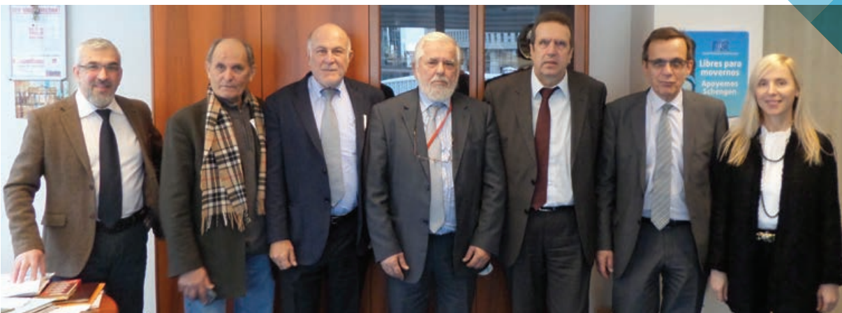
Συνάντηση της ελληνικής Αντιπροσωπείας με τον κ. Γιώργο Ντάση, Πρόεδρο της Ε.Ο.Κ.Ε.