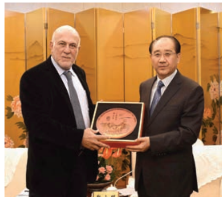
Με τον κ. Zheng Xiaoming Αντιπρόεδρο της Επιτροπής της Σαανσί της Κινεζικής Λαϊκής Πολιτικής Συμβουλευτικής Διάσκεψης