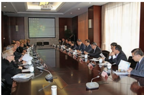
Σαγκάη: Με Μέλη της Επιτροπής της Σαγκάης

Ελλάδος και Κίνας. Ιδιαίτερη αναφορά έκανε και στα συμπεράσματα του 19ου συνεδρίου του ΚΚ της Κίνας, με έμφαση στα ζητήματα της ειρήνης, της ασφάλειας και της παγκόσμιας διακυβέρνησης. Με τη συμπλήρωση δεκαετίας από τη συνομολόγηση το 2006 της «Συνολικής Εταιρικής Στρατηγικής Σχέσης Ελλάδας-Κίνας», οι δύο χώρες εμπλούτισαν τη στρατηγική συνεργασία τους υπογράφοντας νέα κείμενα, όπου μεταξύ άλλων αναγνωρίζεται ο εποικοδομητικός ρόλος που διαδραματίζει η χώρα μας σε γεωστρατηγικό επίπεδο και σε επίπεδο