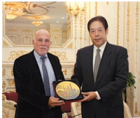
Με τον κ. Wu Zhiming, Πρόεδρο της Επιτροπής της Σαγκάης της Κινεζικής Λαϊκής Πολιτικής Συμβουλευτικής Διάσκεψης