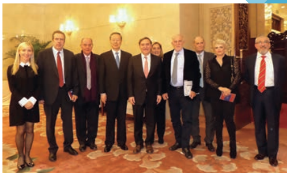
Πεκίνο: Με τον Πρόεδρο κ. Du Qinglin

Κατά τη διάρκεια των συναντήσεων, ο Πρόεδρος της ελληνικής Ο.Κ.Ε. αναφέρθηκε στον αρχαίο πολιτισμό των δύο χωρών και στη μακροχρόνια φιλία που τις συνδέει, η οποία εκφράζεται και μέσα από τις στενές σχέσεις των Οικονομικών και Κοινωνικών Συμβουλίων