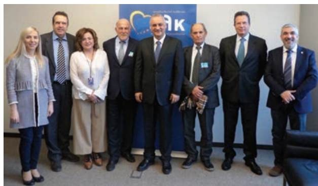
Με τους Έλληνες Ευρωβουλευτές της Νέας Δημοκρατίας

Τ ην Τετάρτη, 1η Μαρτίου 2017, ο κ. Γιώργος Βερνίκος , Πρόεδρος της Ο.Κ.Ε., οι κ. Γιώργος Καρανίκας και Φώτης Κολεβέντης , Αντιπρόεδροι, ο κ. Απόστολος Ξυράφης , Γενικός Γραμματέας, και η Δρ. Μάρθα Θεοδώρου , Υπεύθυνη Διεθνών και Δημοσίων Σχέσεων, συναντήθηκαν με τον κ. Δημήτρη Παπαδημούλη , Αντιπρόεδρο του Ευρωπαϊκού Κοινοβουλίου και τους Έλληνες Ευρωβουλευτές κ. Νίκο Ανδρουλάκη , κυρία Ελίζα Βόζεμπεργκ , κ. Γιώργο Γραμματικάκη , κυρία Εύα Καϊλή , τους κ. Μανώλη Κεφαλογιάννη , Στέλιο Κούλογλου , την κυρία Κωνσταντίνα Κούνεβα , τους κ. Μιλτιάδη Κύρκο , Γιώργο Κύρτσο , την κυρία Μαρία Σπυράκη και τον κ. Κώστα Χρυσόγονο . Ο Πρόεδρος και οι Αντιπρόεδροι της Ο.Κ.Ε. Ελλάδος ενημέρωσαν τους Έλληνες Ευρωβουλευτές για το έργο της Επιτροπής. Επίσης, αναφέρθηκαν στις πρωτοβουλίες της για το μεταναστευτικό και το προσφυγικό ζήτημα, τα εργασιακά, τη Βιώσιμη Ανάπτυξη και το Αναπτυξιακό Σχέδιο για τη χώρα. Οι Έλληνες Ευρωβουλευτές ζήτησαν να αναπτυχθούν διάλογοι επικοινωνίας με την Ο.Κ.Ε. ώστε να υπάρξει ανταλλαγή πληροφοριών και εμπειριών για ζητήματα ύψιστου ενδιαφέροντος, τόσο για τις ευρωπαϊκές κοινωνίες γενικότερα, όσο και για την Ελλάδα ειδικότερα.