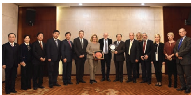
Σιάν: Συνάντηση με τον Αντιπρόεδρο και Μέλη της Επιτροπής της Σαανσί