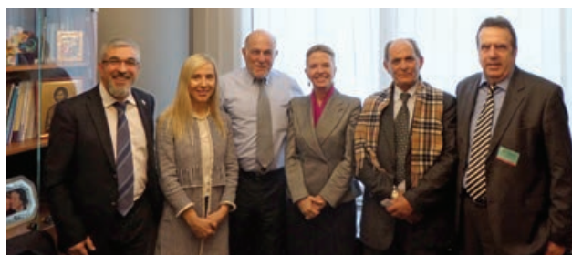
Με την κυρία Ελίζα Βόζεμπεργκ, Ευρωβουλευτή της Νέας Δημοκρατίας