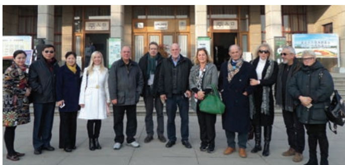
Σιάν: Επίσκεψη στο Μουσείο του Πήλινου Στρατού