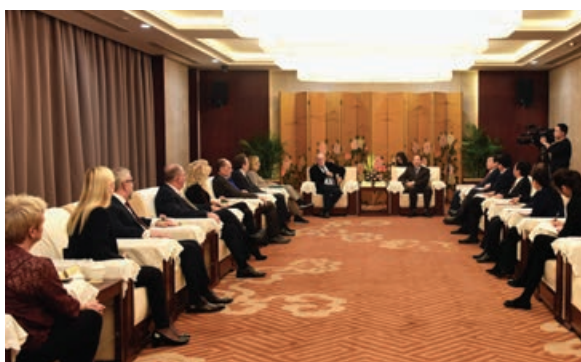
Σιάν: Με τον Αντιπρόεδρο κ. Zheng Xiaoming