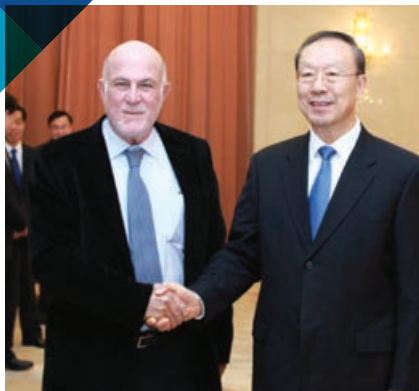
Με τον κ. Du Qinglin, Πρόεδρο του Ο.Κ.Σ. Κίνας και Αντιπρόεδρο της Εθνικής Επιτροπής της Κινεζικής Λαϊκής Πολιτικής Συμβουλευτικής Διάσκεψης