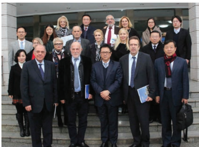
Σαγκάη: Με τον Πρόεδρο του Πανεπιστημίου Διεθνών Σπουδών (SIU)