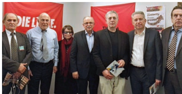
Με τους Έλληνες Ευρωβουλευτές του Συνασπισμού Ριζοσπαστικής Αριστεράς